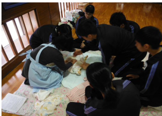
赤ちゃん抱っこ体験