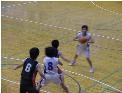
バスケットボール部