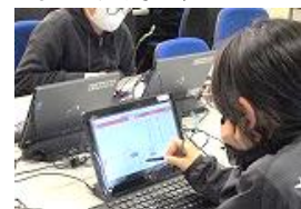
オンラインドリルで習熟を図ります