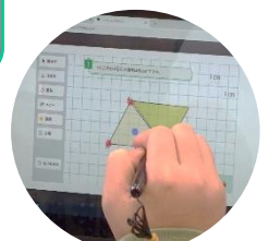
試行錯誤しながら自分の考えを表現します