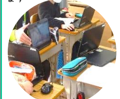
話し合い、意見交換を通して自分の考えを再構築します