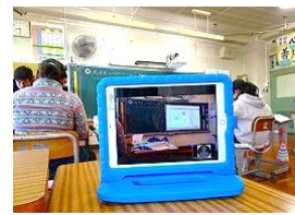
欠席時も家庭で学習に参加することができます