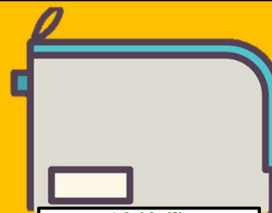
連絡袋 ※入学式配付予定