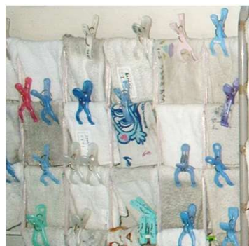
ぞうきん 2枚 1枚のみ記名