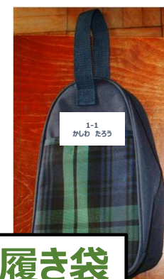
上履き・上履き袋