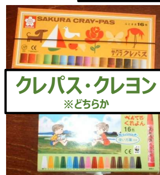
クレパス・クレヨン