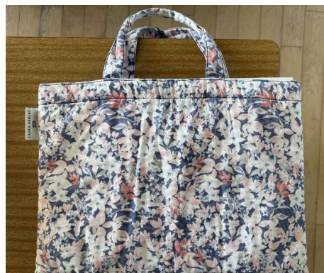
図書バック(手さげ)