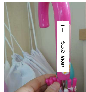
かさ (教室に置き傘置き場あり)