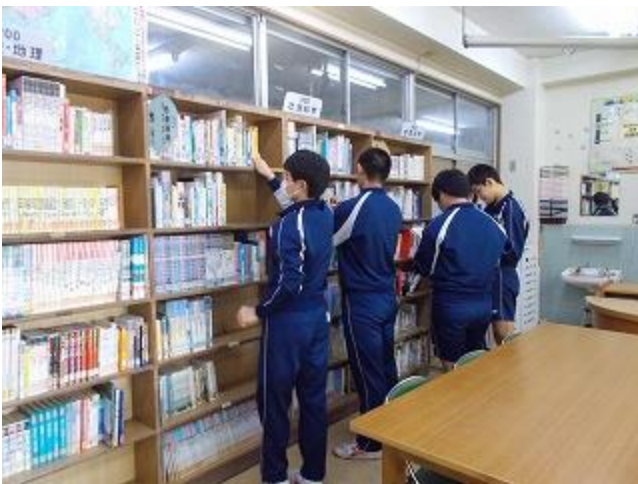
3年生は高校入試を控えているため、