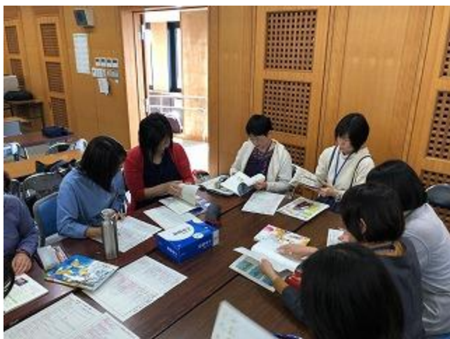
研修④関東地区学校図書館研究大会千葉大会の発表