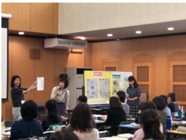
研修②グループワーク「小学校新教科書研究」国語