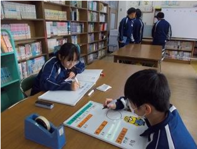
2年生と一緒に学校図書館を運営する

1年生は、とても頼もしい存在です。 『今日は何の日コーナー』と『明日の 図書委員会』掲示板を担当しています。 掲示板最後に書き添えてある「ひとこと コメント」は、立ち止まって読む先生が いるほど人気があります♪