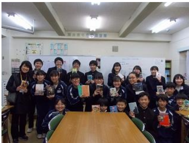
酒井根中学校の図書委員会は、各クラス

からひとりずつ選ばれた21名で活動しています。「本が好きで好きでたまらないから。」「本はあまり読まないけど、学校図書館が好きだから。」など立候補した理由は様々です。