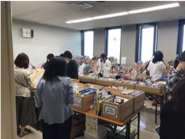
TRCによる新刊展示会会場