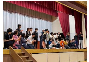
↑ターゲットの方々を、小学生の頃の思い出とともに紹介

これまで、2 学期の授業参観、音楽発表会と同日に PTA 行事を実施して参りましたが、今後は、PTA 行事としての枠組みで行うのではなく、音楽発表会にプロの演奏を鑑賞する機会を PTA で後援するのはどうかという案ができました。ただ、親子で一緒に楽しむ機会はこれからも継続していきたいので、その他の行事で保護者も一緒になって参加できる方法を検討していただきたいと思います。