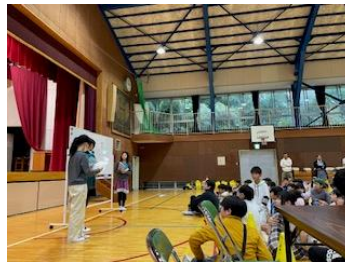
↑閉会式の進行をする 6 年生

楽しい行事を作り上げてくれた 6 年生と先生方、本当にありがとうございました。当日参加して下さった保護者の皆さまにも、感謝申し上げます。