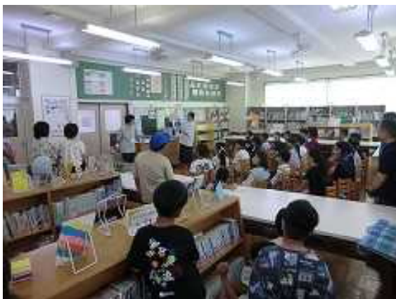
うさぎのみみ読み聞かせ