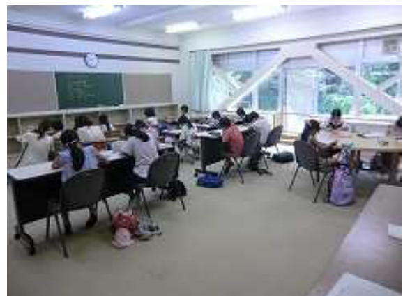
夏休み学習ルーム