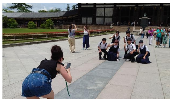
4班はすぐ外国の方に声をかけました！すごい！