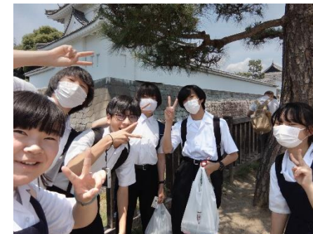
2班、二条城！たくさん歩きましたね！