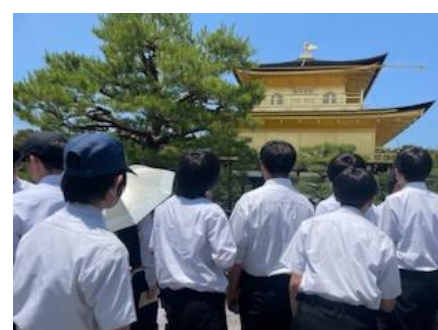
京都といえば金閣！すごいキラキラ具合！