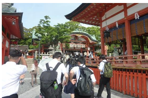
奈良班別研修！1・5班は伏見稲荷ですね！