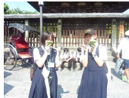
京都班別！1・5班は建仁寺に行きました！