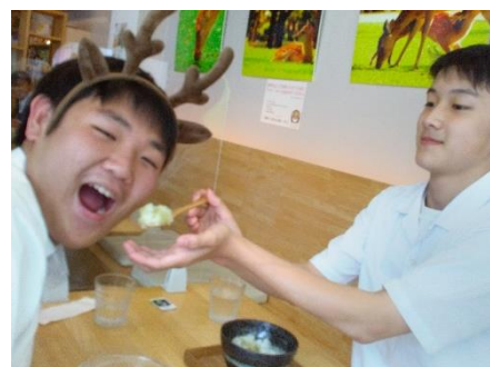
3班は食べる写真が多い！個性が出てます...