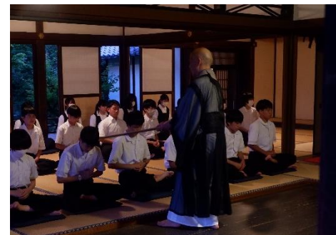
夜は座禅。心は綺麗になりましたか？