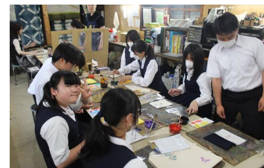
3日目、友禅染め！あっという間の時間でした！