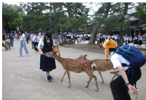
2班はしばらく鹿と戯れていたようです（笑）