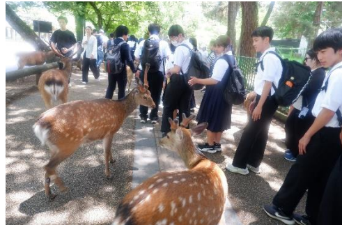
奈良に到着！東大寺へ向かいます！