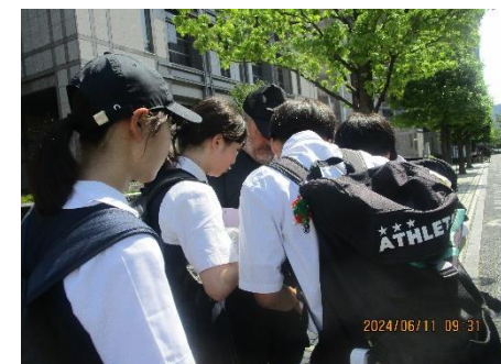
4班、また外国の方と話をしているようです！