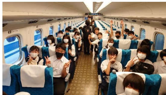
東京駅を出発！いってきま～す