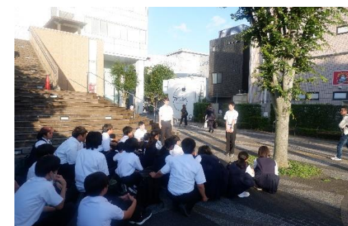
おかえりなさい！たくさん思い出できましたね！