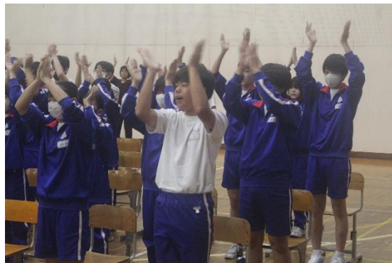
壮行会の様子です！選手の皆さんが実力を出し切ってこられるよう応援しています！頑張れ～！