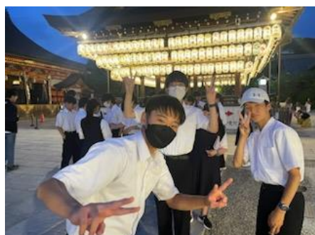
夜の八坂神社へ！静かでいい雰囲気～