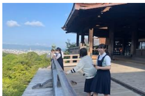
2日目朝は清水寺の散歩です！晴れて良かったね