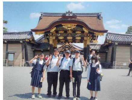
3班は本能寺！実際に見てどうだったでしょうか