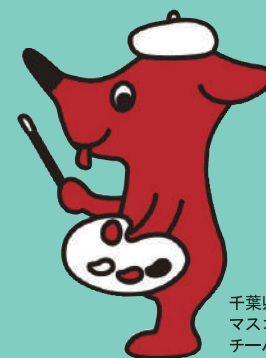
千葉県 マスコットキャラクター チーバくん