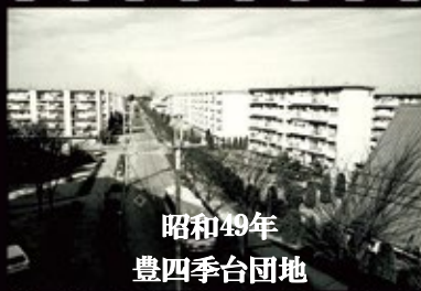
昭和49年 豊四季台団地