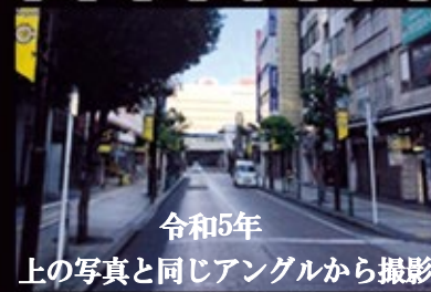
令和5年 上の写真と同じアングルから撮影

BACK TO THE KASHIWA from 150 years ago to modern times