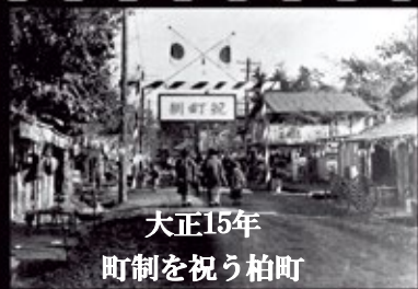
大正15年 町制を祝う柏町