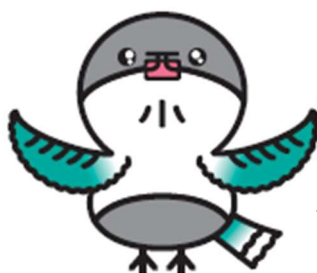
酒西小公式キャラクター サカニシッピー