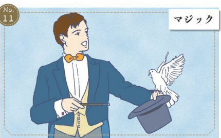
Mr. 八トさん 柏市教育委員会指導員 (1 年)・中学校社会科 (13 年)

色々な種類のマジックを練習し、機会があれば子どもや大人に披露しています。昔はステージマジックを行っていましたが、今では主に少人数に披露するサロンマジックやトランプなどを使用するクローズアップマジックに挑戦しています。