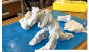
ねん土で作ったよ