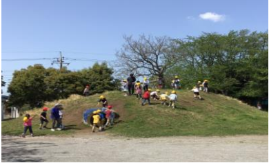
外遊び! がんばり山

新しいことが目白押しの4月だったので、そろそろ今までがんばってきた疲れが出る頃です。休養、早寝早起き、整った生活リズムなどご家庭でのご協力も引き続きよろしくお願ひします。