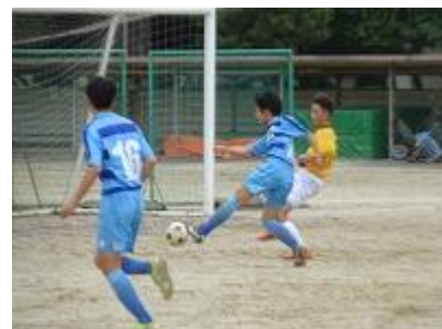
サッカー部高円宮杯 ＜予選リーグ2勝0敗＞