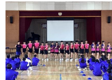
新入生歓迎会(部活動紹介)

実は、西原中で行われる行事や集会のほとんどが、「生徒たちが一から作り上げたもの」ばかりなのです。行事を作り上げるためには、まず生徒会や委員会の代表、実行委員、部長といったリーダーが必要となります。そのリーダーたちは「どんな集会にするか」、「目的は何か」、「全校の前で何を話すか」、「何を、いつまでに、誰が準備するのか」を考えます。そして、企画書を作成し、発表原稿を書き、説明用の動画を撮影し、パワーポイントにまとめ、何度も練習やリハーサルを行い、行事本番を迎えるのです。また、発表内容も、前年度の先輩の真似ではなく、今年度の3年生独自のカラーに革新されたものとなっており、我らが先輩ながらただただ感心してしまいました。