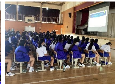
生活委員企画による生徒集会

これから幾度となく行事や集会が開催されます。その際、是非全体を動かしているリーダーたちの「 姿勢・目線・体の動き・話し方・声の大きさ 」などを注目してみてください。リーダーに必要な企画力や発信力を学ぶことができるはずです。一つでも参考にできるところがあったら、各学級で実践してみましょう。全体を動かすために、リーダーの存在は不可欠です。1学年からも素晴らしいリーダーが生まれ、1学年独自の自治活動が形作られていくことを心より期待しています。