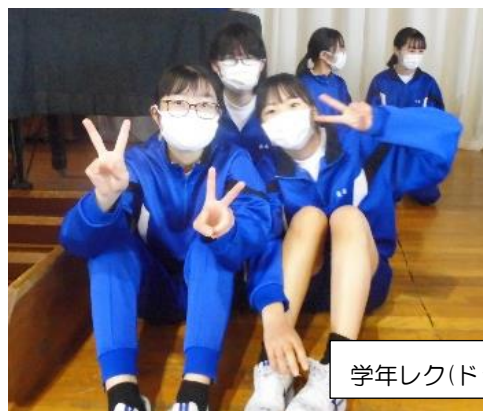
学年レク(ドッチボール大会)の様子

新入生にとって1年先輩である君たちは、部活動を通して、競技のことだけではなく、上記した項目も、後輩に教え導いていく存在になってほしいと思います。言葉を使って、一つ一つ丁寧に教えることもよし、練習に真剣に取り組む態度や姿勢で示すもよし、ミーティングを開