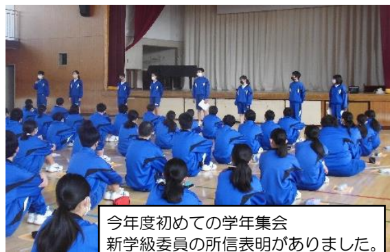
今年度初めての学年集会 新学級委員の所信表明がありました。