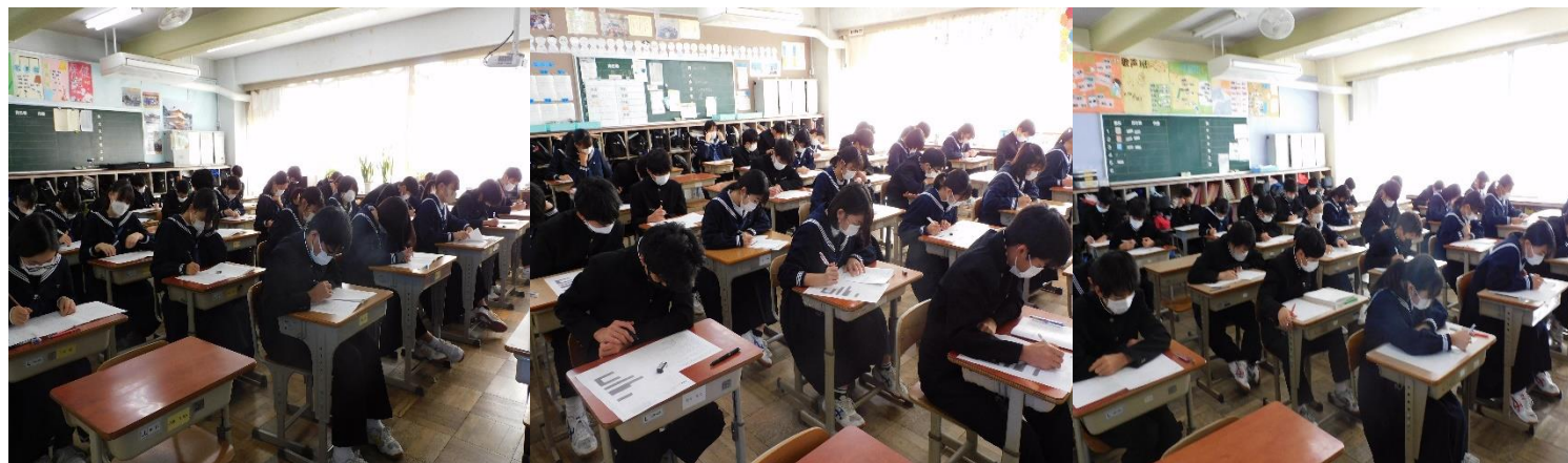
【1・2年生期末テスト、3年生確認テストの様子。本当によく集中しています。】

11月を過ぎると、12月になります。長い2学期も終わりを迎えようとしています。11月は2学期末のテストや3年生の確認テストがありました。さらに今年度は1・2年生で柏市学力学習状況調査があり、テストがたくさんになりました。11月24・25日は、1・2年生の2学期末考査と3年生の確認テストを行いました。2学期の成績に反映されるとテストでもあり、1・2年生は家庭学習を含め、努力を重ねてきたのではないのでしょうか。3年生はこれまでの受験勉強の成果は発揮されましたか。進路決定に向けて、とても大切な時期になります。今後も授業や学習に集中してほしいと思います。