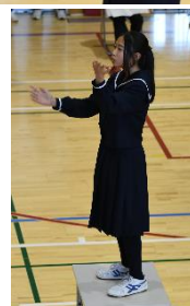
1 年 2 組「大切なもの」