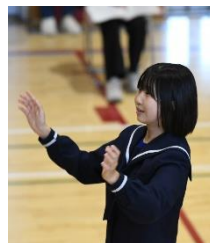
1 年 1 組「HEIWA の鐘」