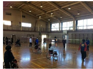
パラバドミントン出前授業

14日(月)・15日(火)には、3～6年生の書き初め教室を開催しました。どの子たちも丁寧に書こうと一生懸命頑張っていました。17日(木)には、6年生でパラバドミントン出前授業が行われました。東京2020パラリンピックから初めて正式種目になったパラバドミントン。選手の方からの直接指導ということもあり、皆真剣な眼差しでした。車椅子に乗り前後に進むには左右の力のバランスが大切だと知った子供達でしたが、なかなか思うように動かず悪戦苦闘していました。でも、リレーや試合の体験を通して、パラバドミントンの魅力に気がついたようでした。