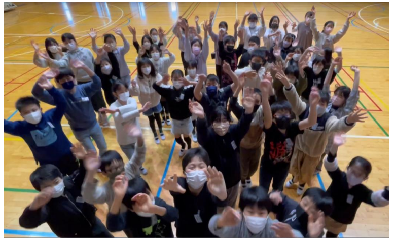
【サプライズソングも送りました】