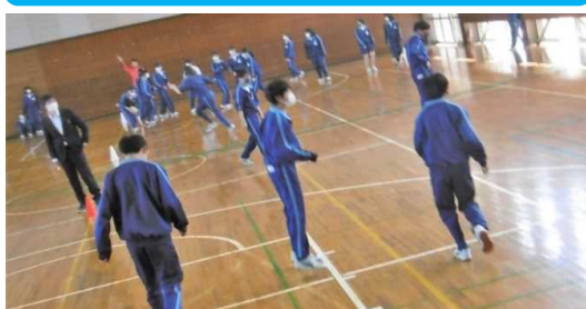
ドッジボールの部 優勝 1組