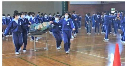
アマソンの空飛ぶ絨毯の部 優勝 3組