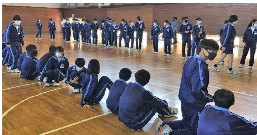
バーステューチェーンの部 優勝 2組