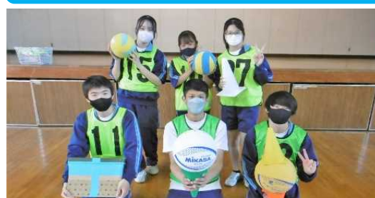
実行委員の皆さんお疲れさまでした

4月17日(月)学年レクを開催しました。実行委員を中心に企画を進め、3つの種目で勝敗を競いました。それぞれのクラスが奮闘し、左のような結果となりました。総合優勝は3組でした。最高学年として風早中を盛り上げていきたいと思ひます。