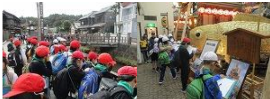
【4年校外学習佐原方面】