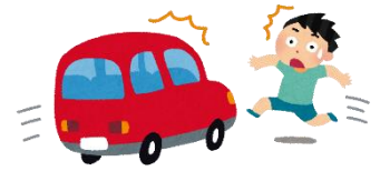
① 状態別年齢別死傷者数

さらに、④のグラフをご覧ください。こちらは死傷に至る原因です。その 1番が「飛び出し」 です。以上のことをまとめるとこうなります。