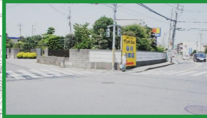
交通量多い 横断注意 曲がって来る自転車に注意