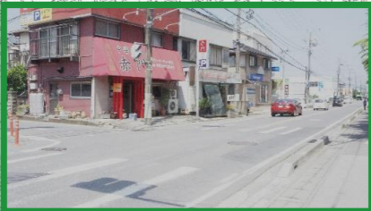
曲がって来る車に注意 歩行者・自転車に注意