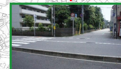
一方通行路 必ず止まって安全確認 よく見て渡る