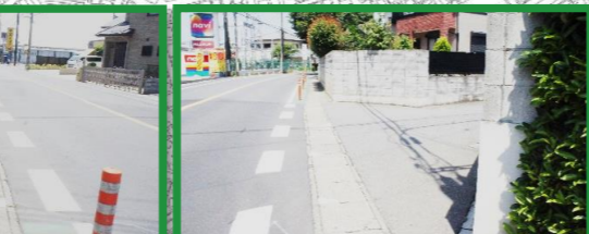
飛び出し注意・左右確認 車の出入りに注意