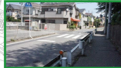
交通量が多い 横断注意