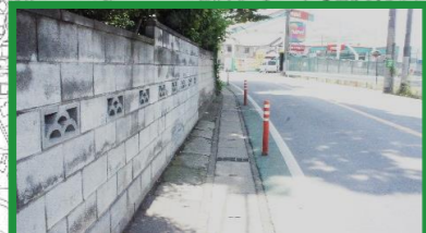
交通量が多い 通行中は広がらない ポールコーン(オレンジの棒)で遊ばない