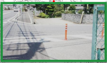
自転車の飛び出し注意