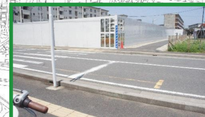
車多し、横断注意 必ず止まって安全確認 よく見て渡る