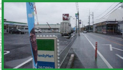
店の出入口 車に注意!