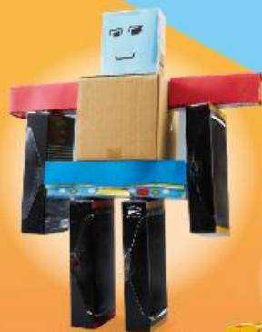
4 おもちゃの ロボット [たかさ20cm] [おまじやのたかさは 70cmに つかいましょう]

はさみ、せっちやくさい、 セロハンテープ、リョウめんテープの つかい方は 60・62ページを みよう。