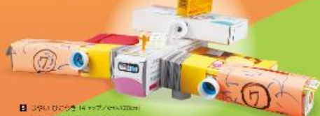
5 おもちゃの ひこうき [タッパ/たかさ120cm] [おまじやのたかさは 20cmに つかいましょう]