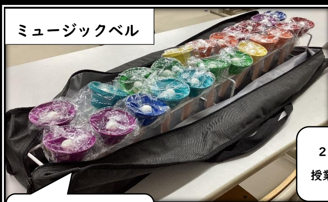
ミュージックベル