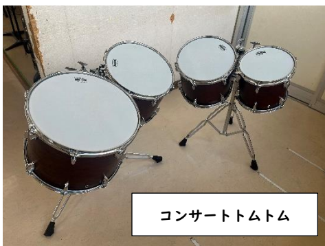
コンサートトムトム