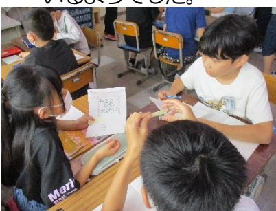
「パンフレットを作ろう」

卒業式までの日めくりカレンダーを1人1枚作成しました。卒業に対する思いや、クラスの友達へのメッセージなどを考えながら、いよいよ卒業が目前に迫っていることを実感しているようでした。