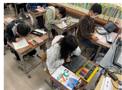
「卒業カウントダウンカレンダー」