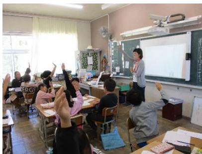
「ショートショートを書こう」

2学期末に、4年生全員でレクを楽しみました。どんな遊びがよいかをクラスで話し合い、どのクラスもルールを工夫して遊びを作り出しました。その中で「人狼おにごっこ」と「運試しリレー」をやりました。思いっきり体を動かして、クラスを超えて楽しく遊んでいました。