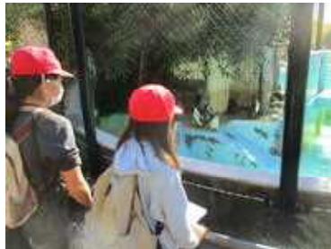
【特別支援学級校外学習】