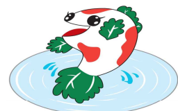
三小公式ゆるキャラ きんしょうウオ

コロナの影響で 制限されていた調 理実習もできるよう になり、練習をし てのカレー作りで した。 どのグループもお いしくできあがりま した。