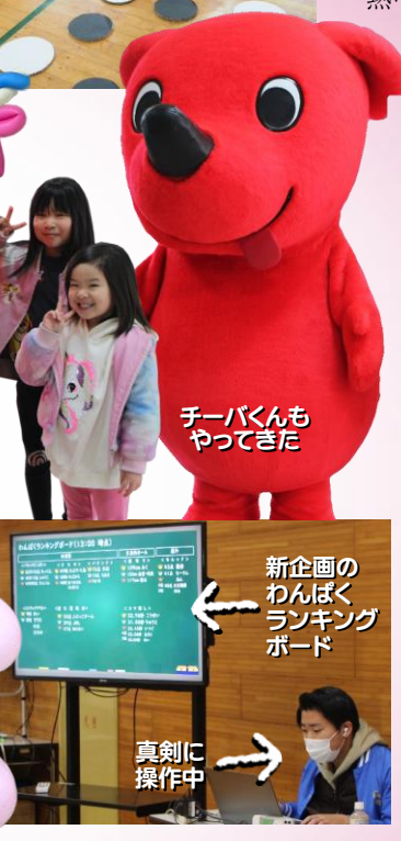
チーバくんもやってきた