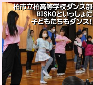
柏市立柏高等学校ダンス部 BISCOといっしょに子どもたちもダンス！