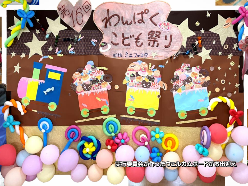
実行委員会が作ったウェルカムボードがお出迎え