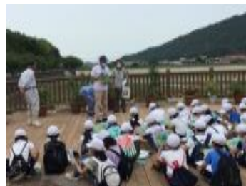
ため池学習の様子