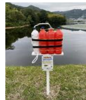
レスキューペットボトル設置