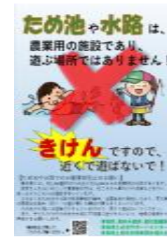
チラシの配布（青森県）