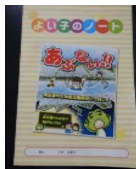
ノートの配布（北海道土地連）