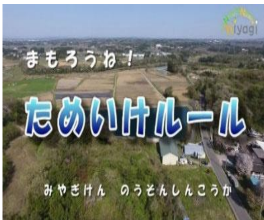
ため池事故防止・注意喚起動画