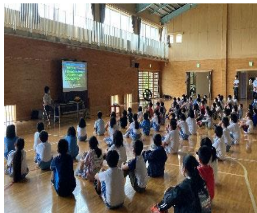
小学校での啓蒙活動