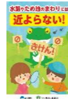
チラシの配布（新潟県）