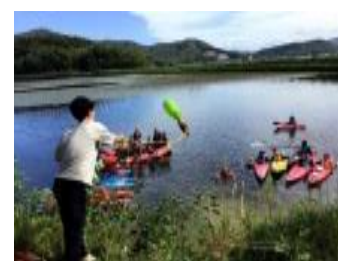
レスキューペットボトル発案