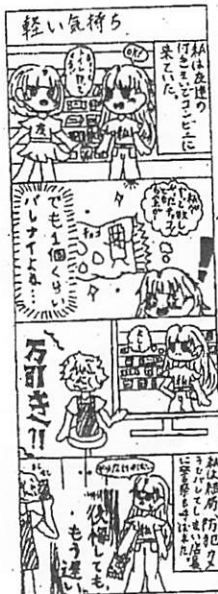
令和6年度優秀賞(土南部小)