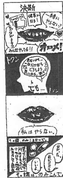
令和6年度優秀賞(豊四季中)