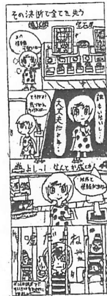
令和6年度優秀賞(柏陵高)