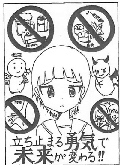
令和6年度作品集表紙(豊四季中)