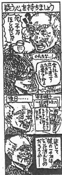
令和6年度優秀賞(豊四季中)