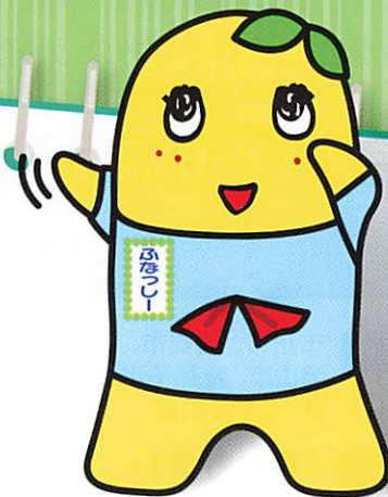
京葉ガスユーザー代表 梨の妖精「ふなっしー」