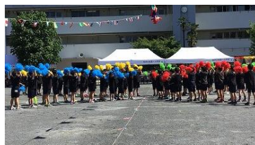
【2年】「みんなにサチアレ」