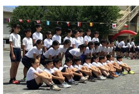
【6年】「集団行動～フラッグパフォーマンス～」