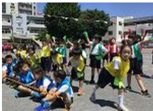
【1年】「1年生やってみよう!!」