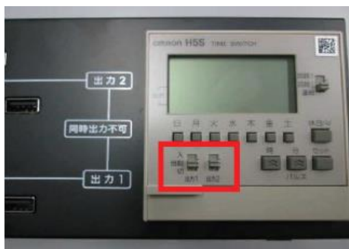
図2 出力「入」「切」スイッチ

ケーブルをきちんと差し込んでおらず充電ができていなかった、持ち帰りをして家で充電を忘れてしまった等、日中に充電するため、タイマーでの自動運行中に、強制的に充電オン、オフにする場合は、図2の出力「入」「切」スイッチを操作してください。電源容量の関係もありますので、緊急時以外の操作はご遠慮ください。