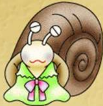
SleepySnail スリーピースネイル

ひるねが大好きなカタツムリ。おしゃべりもせずになてばかりいて、ときどき「あ〜」とか「う〜」とかねごとをいう。