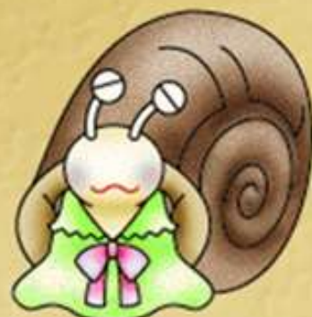
SleepySnail スリーピースネイル

Profile ひるねが大好きなカタツムリ。おしゃべりもせずになてばかりいて、ときどき「あ〜」とか「う〜」とかねごとをいう。