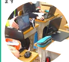
話し合い、意見交換を通して自分の考えを再構築します