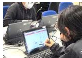
オンラインドリルで習熟を図ります