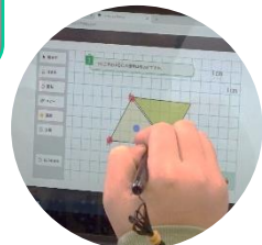
試行錯誤しながら自分の考えを表現します