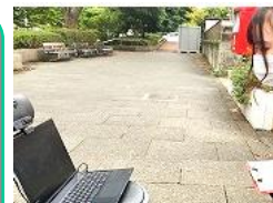
専門家、地域の人とつながります