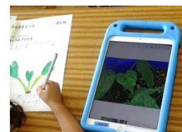
植物を細かいところまで観察します。写真で蓄積可能です