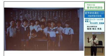
夏季研修講座の動画配信