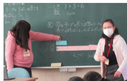
算数支援教員による授業補助