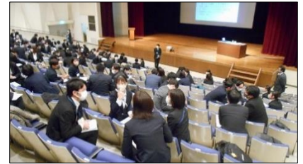
初任研で協議をする小中初任者