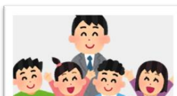
E 特別な配慮や支援を 必要とする子供への対応