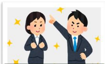
A 教職に必要な素養