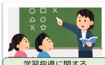
B 学習指導に関する 実践的指導力