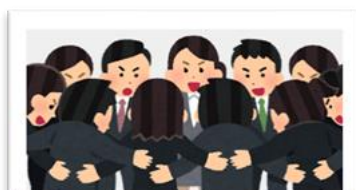
D チーム学校を支える 資質能力