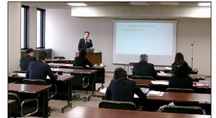
教育長の講話を受講する新任校長