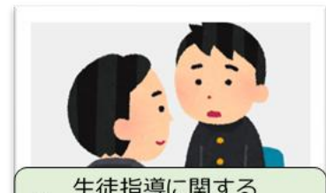
C 生徒指導に関する 実践的指導力