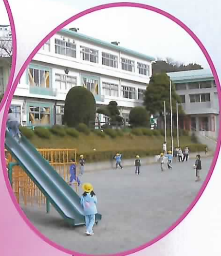
市立柏第四小学校