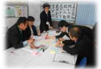
授業参観後、協議会を行う 中堅教諭等資質向上研修受講者