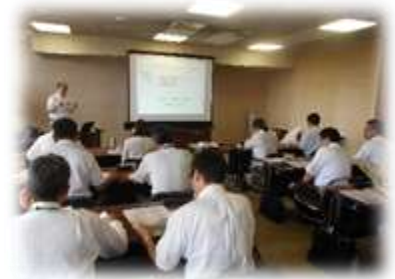
学校経営について学ぶ新任校長