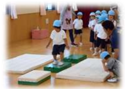
運動遊びをテーマとした幼児教育共同研究