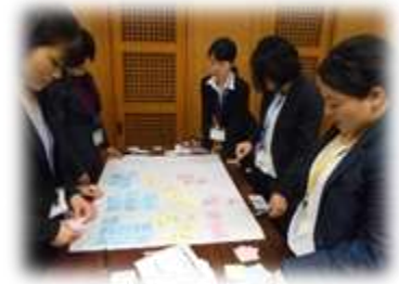
学級経営等について学ぶ小中初任者