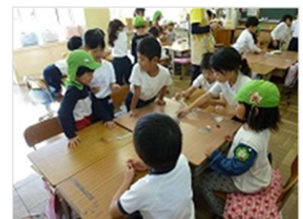
園児と1年生の交流会