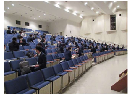
学級経営等について学ぶ小中初任者