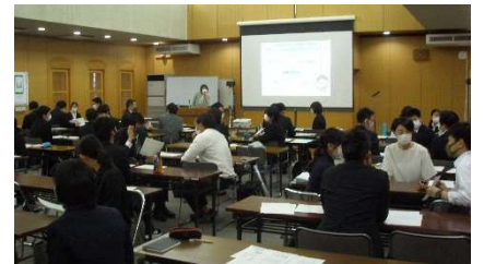
学級経営及び危機管理について学ぶ 新任講師