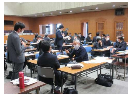
研修の進め方及び役割について学ぶ 初任者研修指導教員