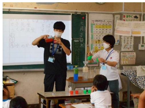
算数支援教員による授業補助